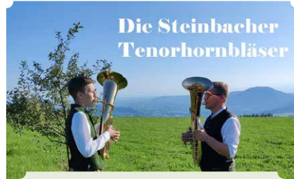
Die Steinbacher Tenorhornbläser