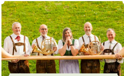
Grünspan & Holzwurm