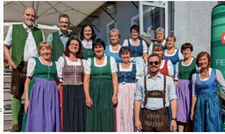
Singkreis St. Stefan ob Stainz