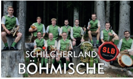
Schilcherland Böhmisches und Musikverein St. Stefan ob Stainz