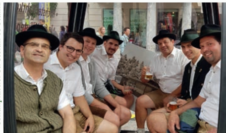
Schuhplattler St. Stefan ob Stainz