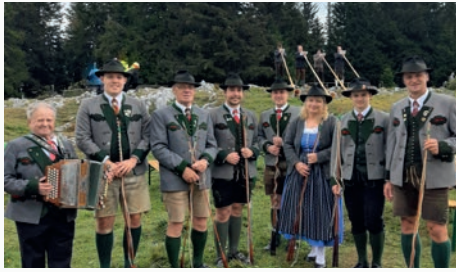
Goßlschnalzer Steirerherzen Knittelfeld