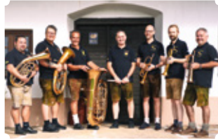
Die Blechvögl aus dem Schilcherland