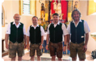
„H4“ Hitzendorfer 4xang

Über 180 Mitwirkende und Akteur:innen unterhalten Sie in Ligist , unter anderem: