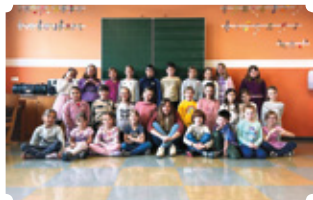
Kinderchor der Volksschule Ligist