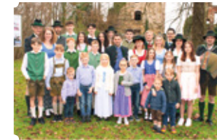
Volkstanz- & Schuhplattler- gruppe Ligist- Krottendorf