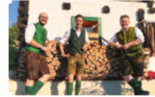
Murtaler Kirchtagmusi (Wanderbegleitung)