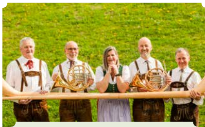
Grünspan & Holzwurm