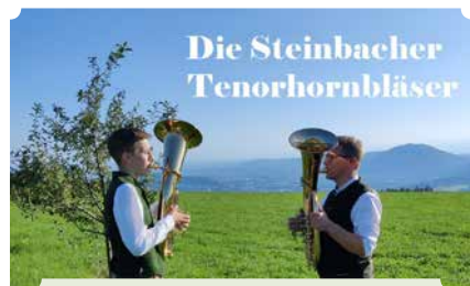
Die Steinbacher Tenorhornbläser