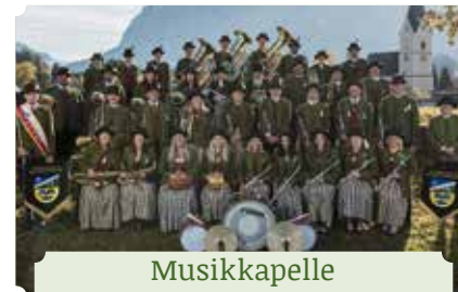
Musikkapelle Bad Mitterndorf