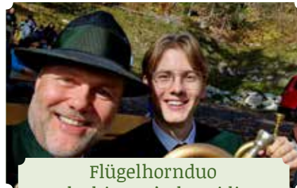
Flügelhornduo Blechig & G'schmeidig