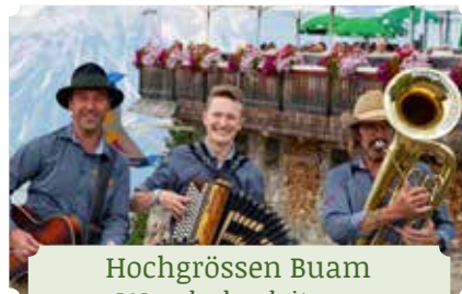
Hochgrößen Buam Wanderbegleitung