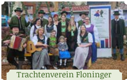
Trachtenverein Floninger Kapfenberg