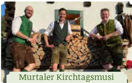
Murtaler Kirchtagsmusi Wanderbegleitung