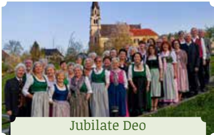
Jubilata Deo PfarrverbandsChor