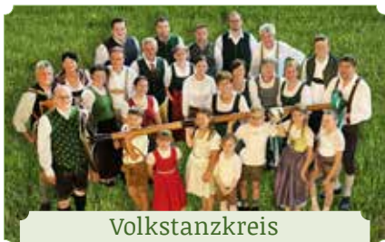
Volkstanzkreis St. Johann ob Hohenburg