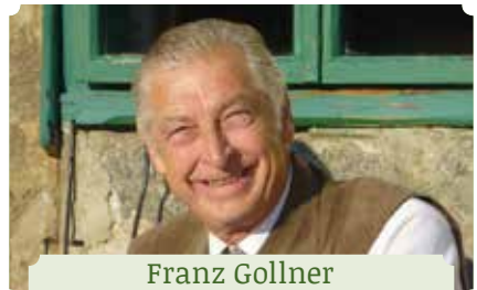
Franz Gollner Literarische Wanderung